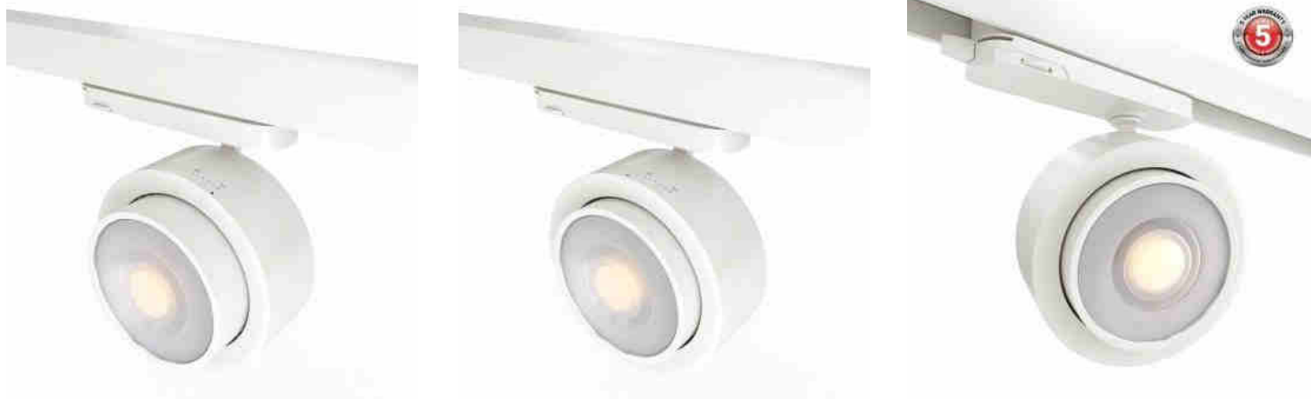
Projecteur LED circulaire pour rail triphasé 35W - ZOOM 15°- 45° - 4000K - CRI 90