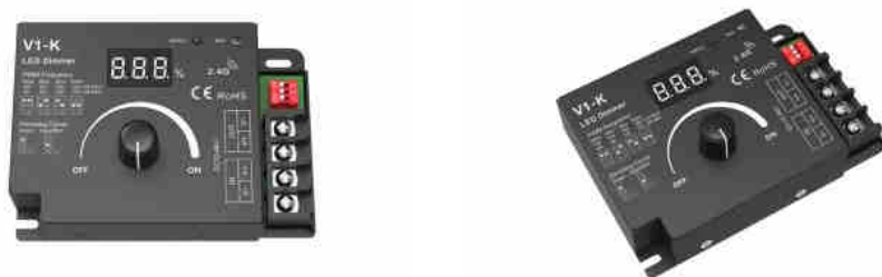
Mechanical Structures and Installations