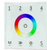
T13 RGB panel