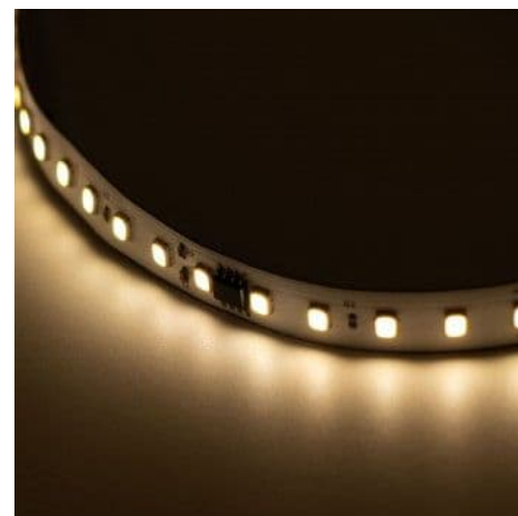
Ruban LED monochrome intelligent IC 24V DC - 15W/m - IP20 - 120LED/m - Largeur 10 mm - 10 mètres