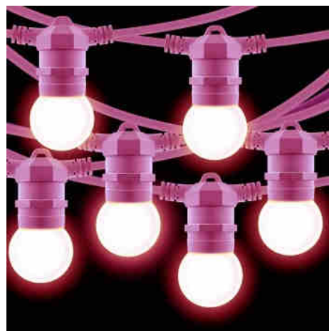
Kit guirlande lumineuse extérieure 10 mètres + 10 ampoules LED E27 1W - IP44 - Blanc chaud