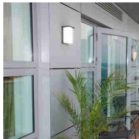
Applique murale extérieure en aluminium "Block" - Puissance réglable : 12W-14W-16W - CCT- IP65