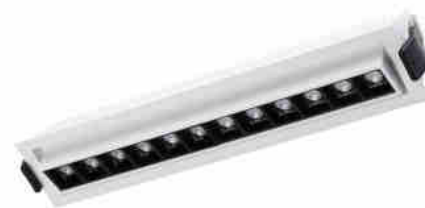
Spot LED encastré linéaire 20W - Orientable - UGR18 - IRC90 - Puce OSRAM - 2800K