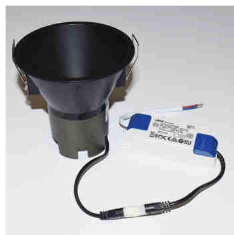
Spot LED encastrable 10W "KOPPA" - Optique 24° - Coupe Ø 100mm - Faible UGR